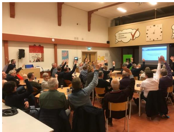
Bij de vraag: “Willen we in Leuvinksveld mee doen aan dit plan?” Werd door vrijwel alle aanwezigen instemmend gereageerd!

“Op basis van wat ik vanavond heb gehoord, vind ik het logisch om met het plan in Leuvinksveld te beginnen”