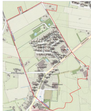
Overzicht van het plangebied (vergroete versie op aanvraag beschikbaar)